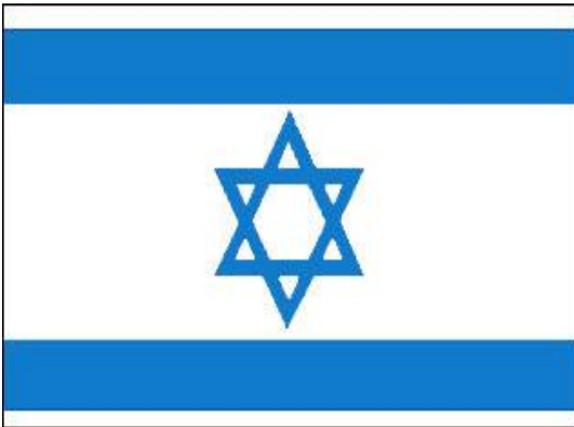
De Israëliische vlag. Wit doek met blauwe Davidster.

De Menorah is wel terug te vinden in geschriften uit de oudheid als specifiek Joods symbool en ook in de Bijbel is deze terug te vinden, terwijl er van een zespuntige ster als Joods symbool met geen woord gerept wordt.